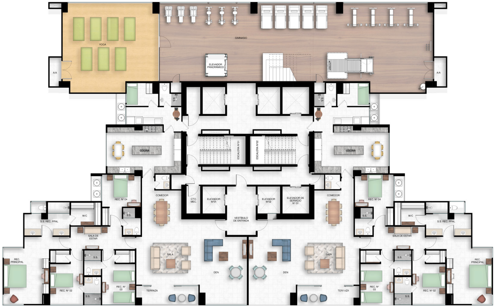
PLANTA ARQUITECTÓNICA NIVEL 4400