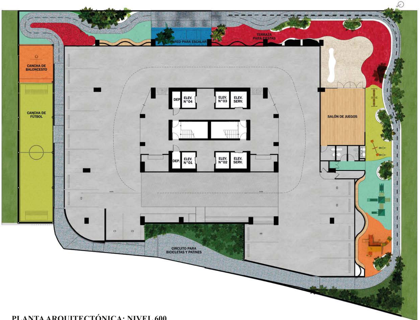
PLANTA ARQUITECTÓNICA: NIVEL 600